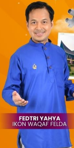
FEDTRI YAHYA IKON WAQAF FELDA